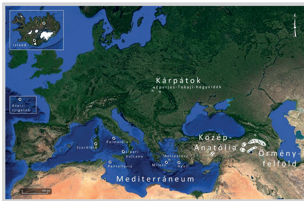
3. ábra. Az obszidián földtani lelőhelyeinek elhelyezkedése Európában és Kis-Ázsiában (szerk. Kiss G.)