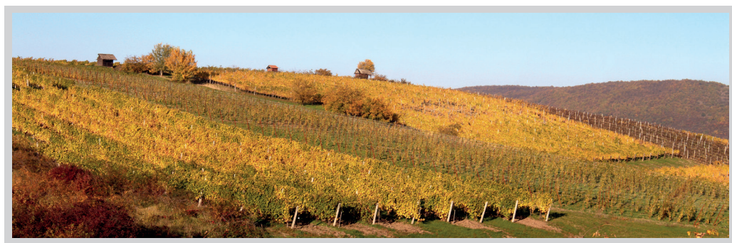
7. ábra. Az erdőhorváti Szokolya riolitvulkáni komplexumának Tolcsva környéki hegylábi része azon kevés földtani lelőhelyek egyike, ahol az obszidián fekete és vörös színváltozata is előfordul

A lelőhelycsoport kárpáti szintű különlegessége a vörösobszidián előfordulása a tolcsvai szőlőhegyek egyik kisebb kiterjedésű sávjában (7. ábra). A környező lelőhelyen