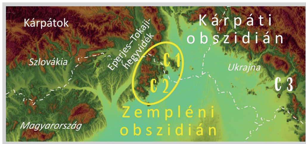
4. ábra. A kárpáti és zempléni obszidián nevezéktana (szerk. Kiss G.)

A zempléni obszidiánok karakterüket tekintve igen változatosak. Míg kémiai jellemzőik alapvetően a kőzetté válás során (szingenetikusan) alakultak ki, addig ma látható arculatukat jelentős mértékben meghatározzák az elmúlt évmilliók során