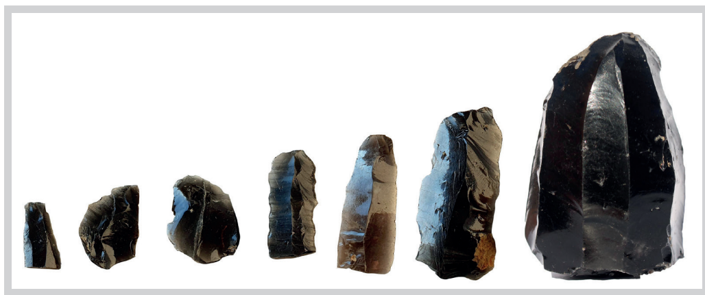
9. ábra. A Zempléni-szigetehegység földtani lelőhelyein gyűjtött magas üvegfényű obszidiánból készültek a legjobb minőségű és legszebb pattintott kőeszközök az őskorban

A viszonylag kiszámú geológiai lelőhely miatt az obszidián általában kifejezetten ritka kőeszköz-alapanyag volt. A paleolit kori leletek esetében a teljes eszközkészletben az obszidián aránya jellemzően 10%-nál kisebb (T. BIRÓ K. 2004, 2007). Kivételt képeznek a jó minőségű nyersanyagforrások közvetlen környezetében lévő telepek, így a zempléniak is. Bodrogkeresztúr–Hénye felső paleolit kori telepén például a több ezer feltárt kőeszköz közel 20%-a készült obszidiánból, míg a meghatározó alapanyag a térségben szintén fellelhető limno- és hidrokvarcit volt. Kivételesek a Céke és Kásó határában feltárt kőkori műhelyek, amelyeken a helyben bőségesen elérhető, jó minőségű obszidián szinte kizárólagos, ami alapján valószínűsíthető, hogy ezek a telepek kimondottan a fekete vulkáni üvegre, mint eszközalapanyagra specializálódtak (9. ábra).