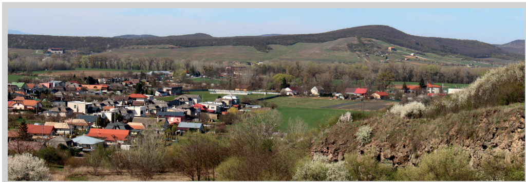
6. ábra. A Borz-hegy (Borsuk) riolitvulkáni komplexuma a zempléni obszidián egyik klasszikus lelőhelye

nagymeretű, lekerekített, megjelenésükben ágyúgolyókra emlékeztető obszidián gumók kerültek elő innen. E kivételes alkalom során a fekete vulkáni üveg közetrétegtani viszonyait PAVEL BAČO és munkatársai (2018) részletesen dokumentálták.