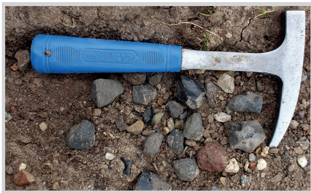
8. ábra. Változatos karakterű obszidiánok másodlagos jellegű földtani lelőhelye az Erdőbényei-félmedence Bodrog felőli részén

A lelőhelycsoport az erdőhorvati Szokolya és a Molyvás-hegycsoport obszidiánt rejtő hegyeinek előterében, tájföldrajzi értelemben Tokaj-Hegyalja részét képező Erdőbényei-félmedence délkeleti, Bodrog felőli részén található. Eredetét tekintve részben másodlagos jellegű: a felszínen és felszínközeli részben lévő obszidián gumók jórészt a pleisztocén korban, a környező hegyek felől a mély fekvésű előtér felé irányuló lejtős tömegmozgásos folyamatok révén kerültek az itteni hegyláb lejtőkre (8. ábra). Obszidián gumók a több méter vastagságú lejtőüledékben és az annak felszínén kialakult talajtakaróban egyaránt előfordulnak. A pleisztocén és az azt fedő vékonyabb holocén kori rétegeket helyenként a hegyláb felszínbe mélyülő eróziós árkok tárják fel. Az egyik árok vastag lejtőüledékeket feltáró oldalfalaiban obszidián gumók is megfigyelhetők. A lelőhely másodlagos jellegének egyik szemléletes következménye az obszidiánok változatos karaktere. Egyik különlegessége, hogy itt egy helyen található meg a két másik magyarországi lelőhely-csoport (Z 2 és Z 3) obszidiánja, a Meszes vonulatának grafit-szürke és az erdőhorvati Szokolya-hegycsoport tömbjének fekete, fényes vulkáni üvege. A tolcsvai vörösobszidián előfordulása – mind a felszínen, mind az árok oldalfalában feltároló lejtőüledékekben – tovább „színesíti” a kőzetüvegek olaszliszkai palettáját.