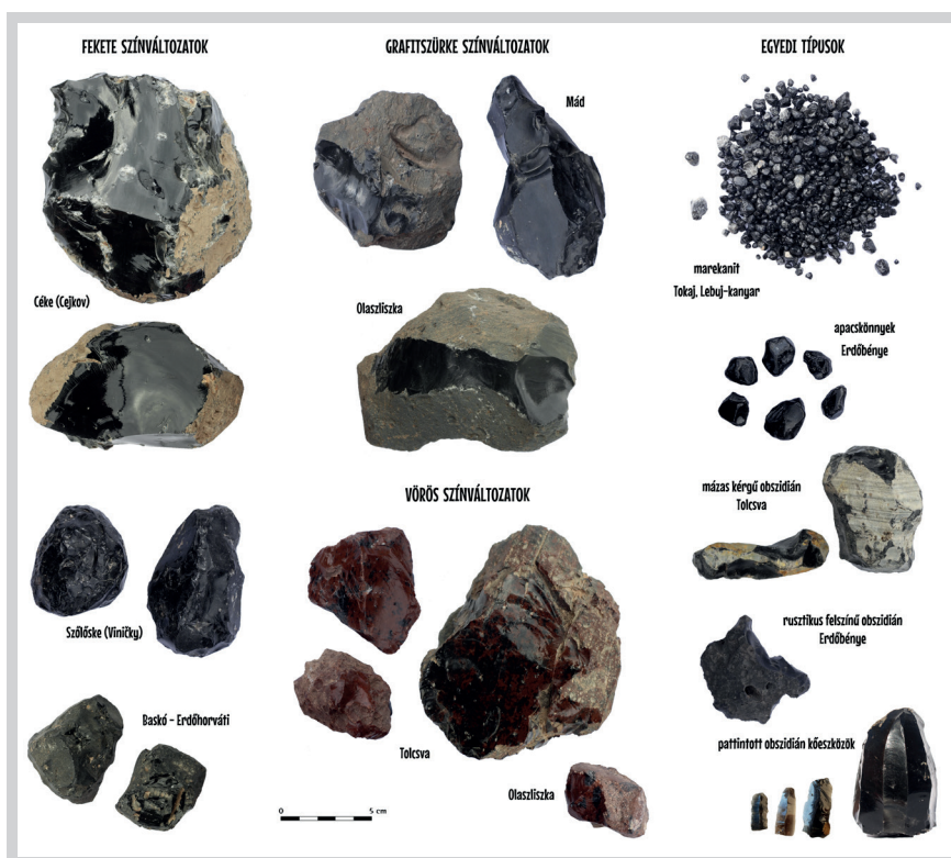
1. ábra. A kárpáti (zempléni) obszidiánok változatossága (szerk. Kiss G.)

A vulkáni üveg színét alapvetően a láva hőmérséklete és összetétele határozza meg,